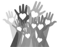
Bürgerfonds WALDBRUNN e.V.

Bürgerfonds Waldbrunn e. V. Der Vorstand